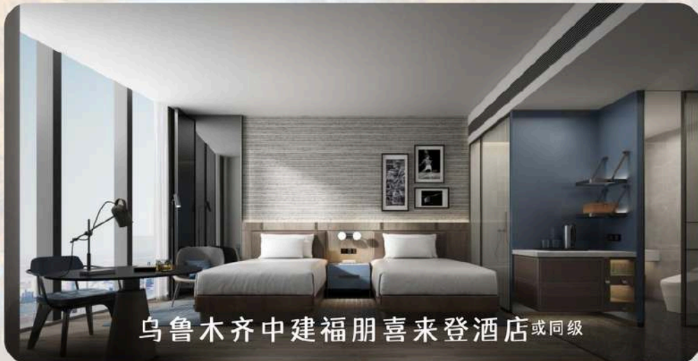
乌鲁木齐中建福朋喜来登酒店 或同级