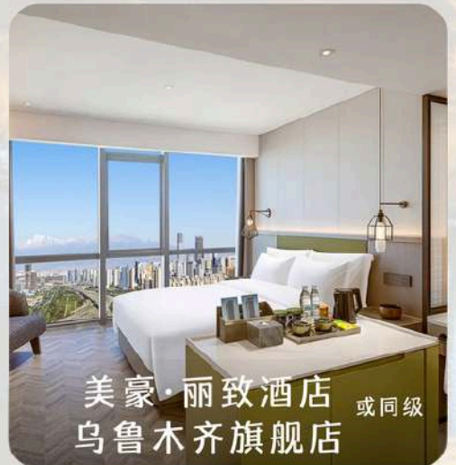
美豪·丽致酒店 或同级 乌鲁木齐旗舰店