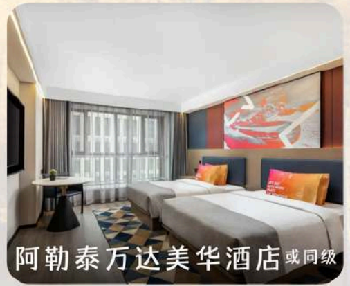
阿勒泰万达美华酒店 或同级