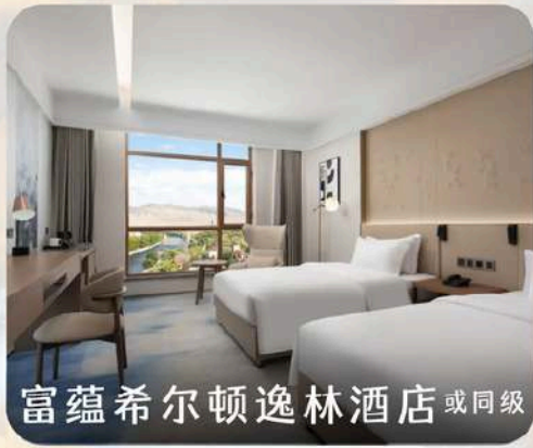
富蕴希尔顿逸林酒店 或同级