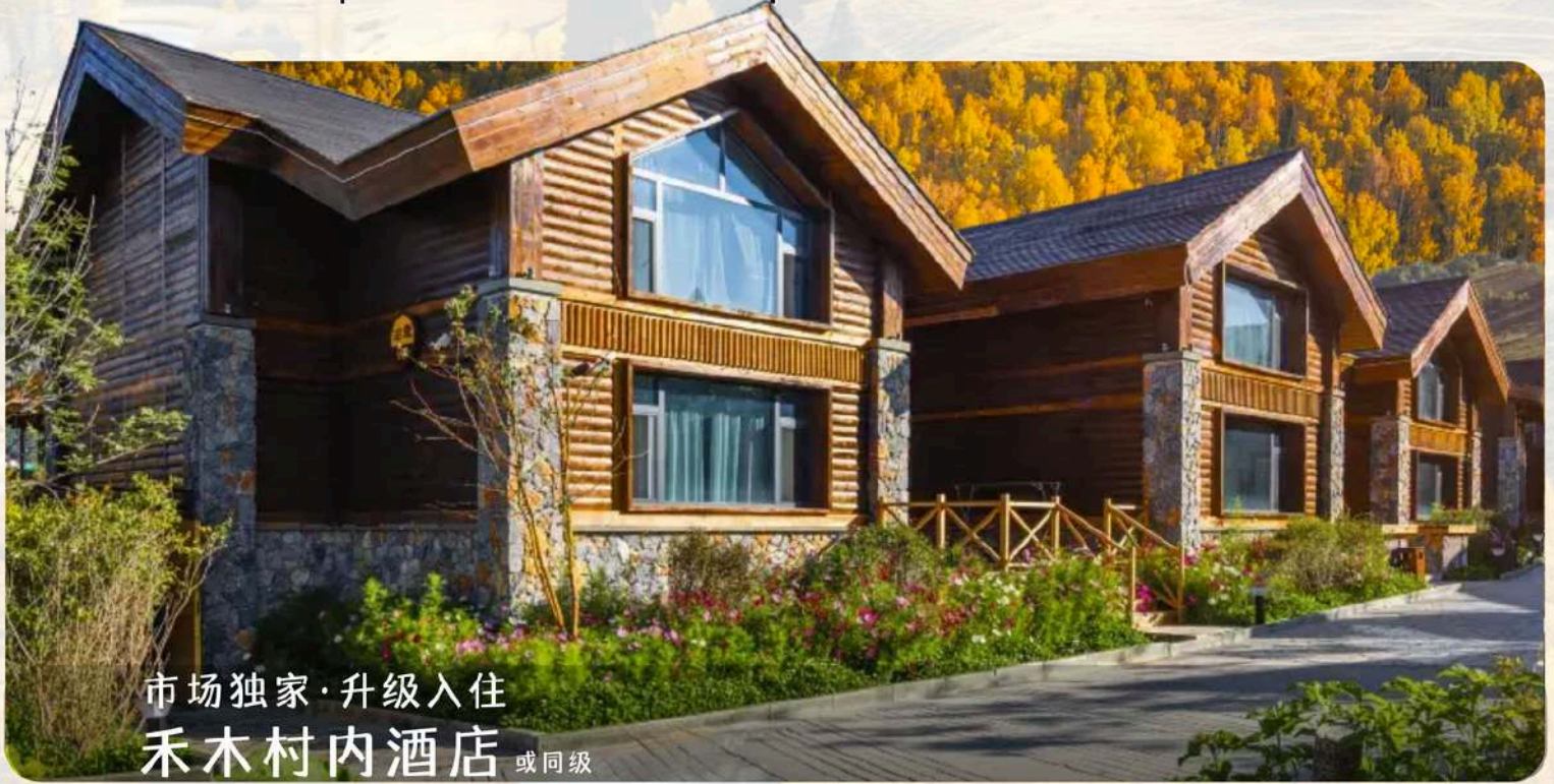
市场独家·升级入住 禾木村内酒店 或同级