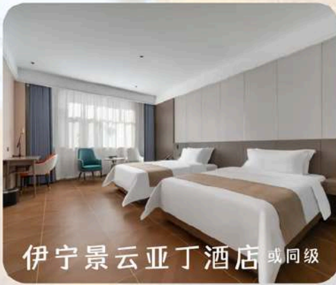
伊宁景云亚丁酒店 或同级