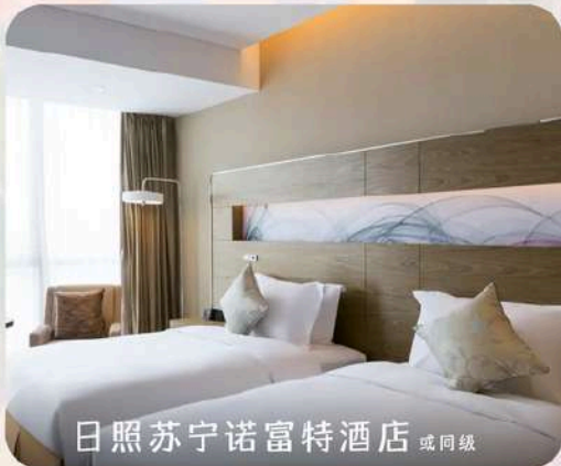
日照苏宁诺富特酒店 或同级