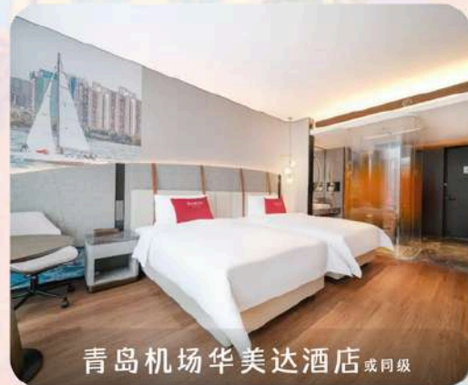
青岛机场华美达酒店 或同级