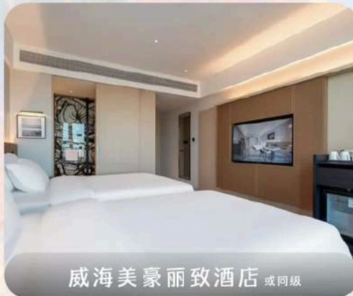
威海美豪丽致酒店 或同级