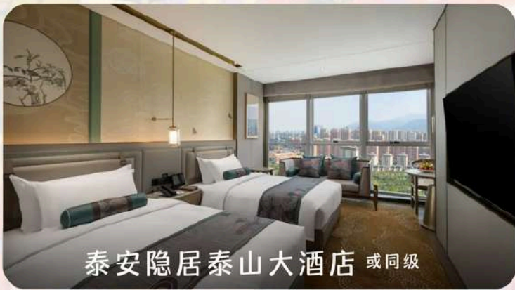
泰安隐居泰山大酒店 或同级