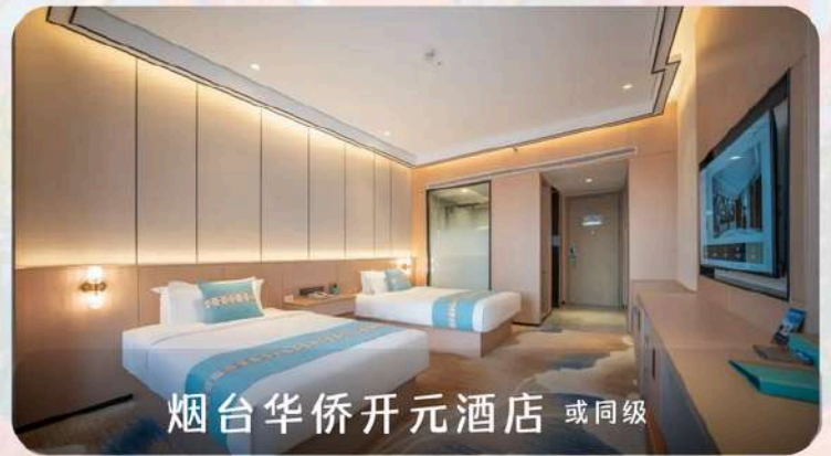
烟台华侨开元酒店 或同级