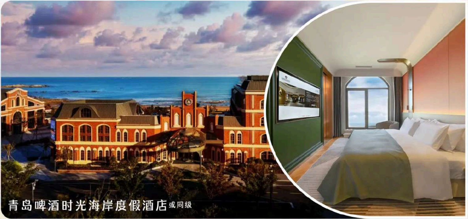
青岛啤酒时光海岸度假酒店 或同级