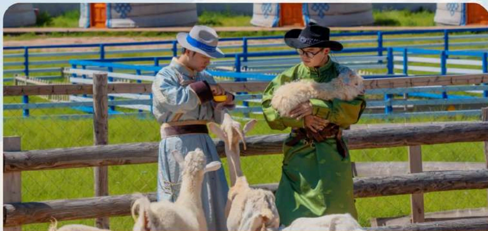
2026 全新升级：赠送那达慕娱乐套票