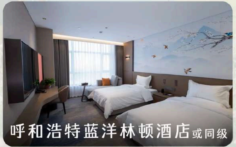
呼和浩特蓝洋林顿酒店 或同级