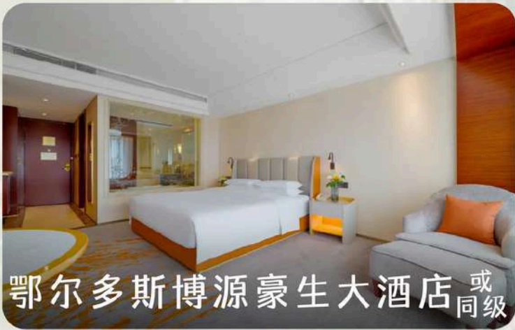
鄂尔多斯博源豪生大酒店 或同级