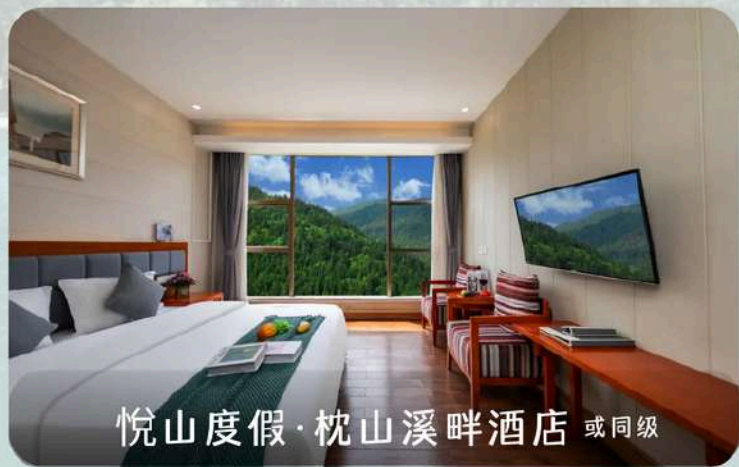
悦山度假·枕山溪畔酒店 或同级