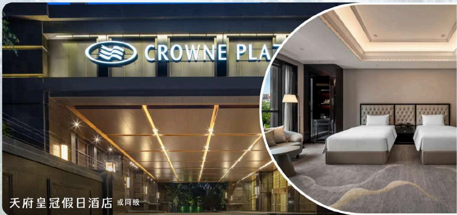
天府皇冠假日酒店 或同级