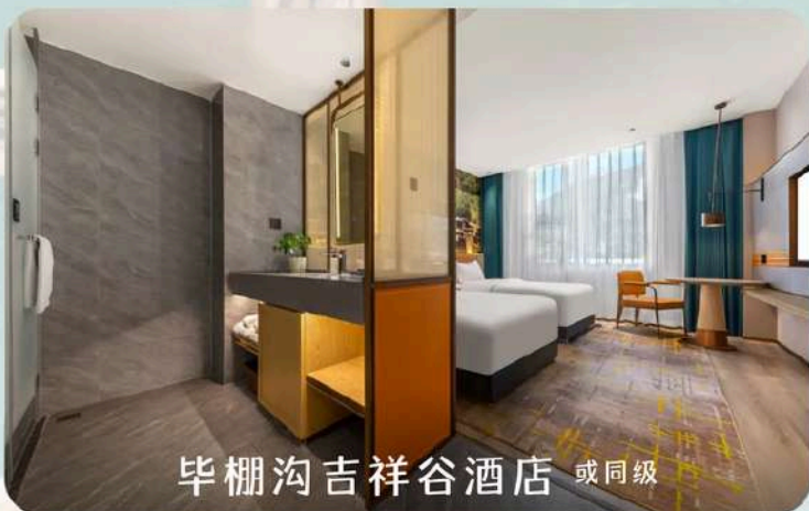
毕棚沟吉祥谷酒店 或同级