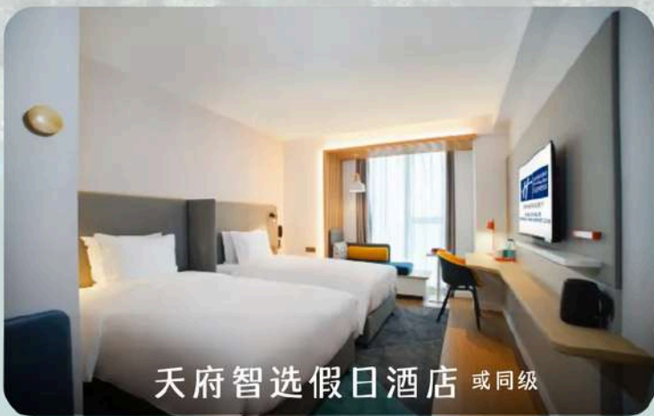
天府智选假日酒店 或同级