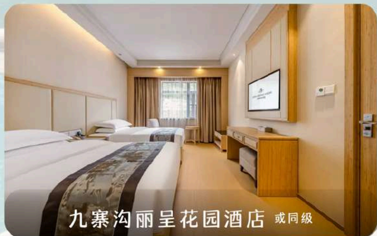
九寨沟丽呈花园酒店 或同级