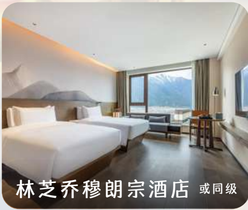
林芝乔穆朗宗酒店 或同级