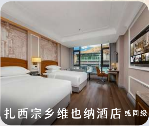
扎西宗乡维也纳酒店 或同级