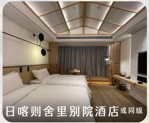
日喀则舍里别院酒店 或同级