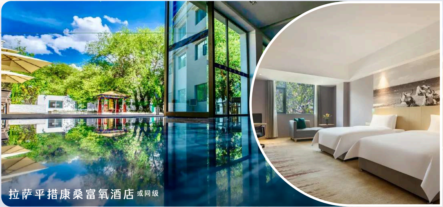
拉萨平措康桑富氧酒店 或同级