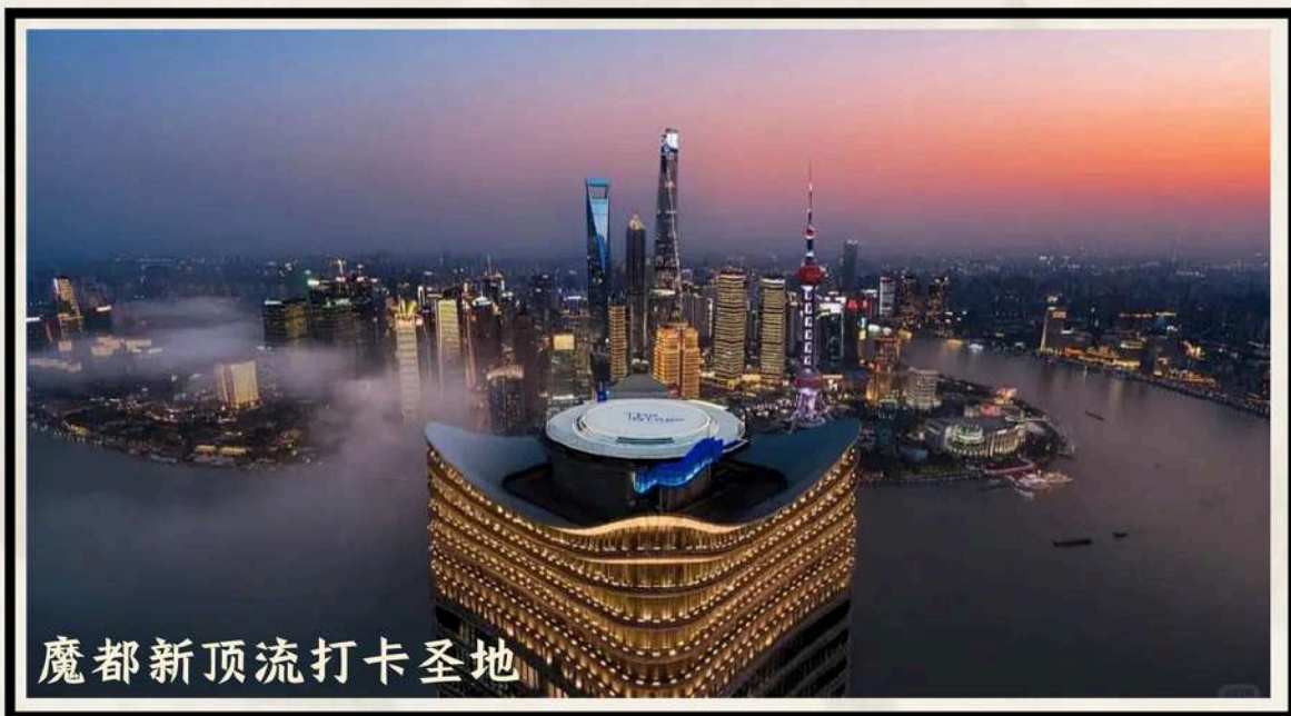
魔都新顶流打卡圣地

上海 SHANGHAI · 苏州 SUZHOU · 海宁 HAINING · 杭州 HANGZHOU · 桐乡 TONGXIANG