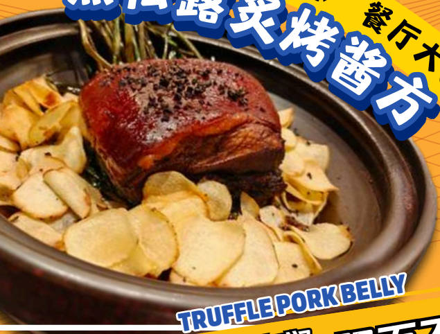
TRUFFLE PORK BELLY