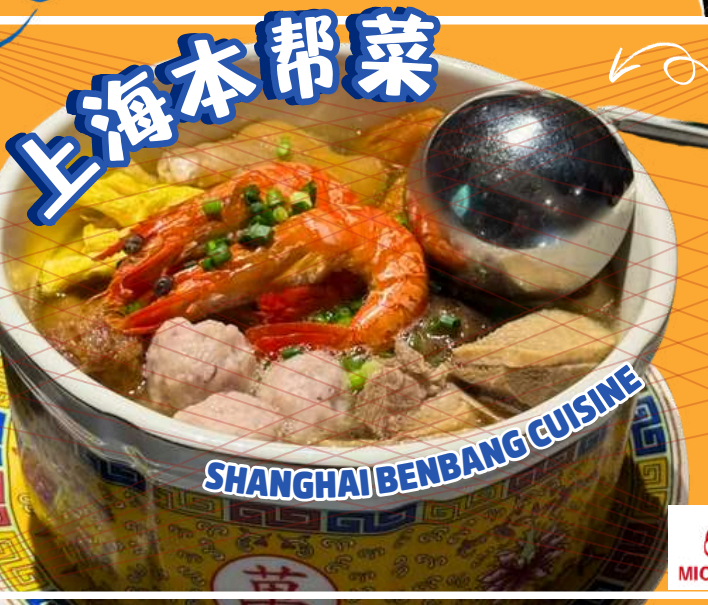
SHANGHAI BENBANG CUISINE