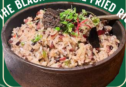
THE BLACK TRUFFLE FRIED RICE