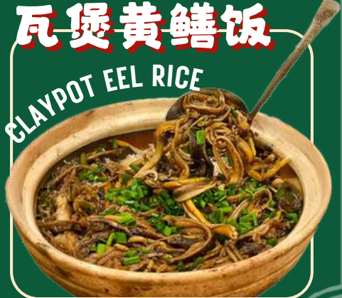
CLAYPOT EEL RICE