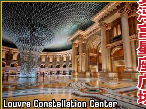
Louvre Constellation Center

穿越历史，感受岭南风情 Travel Through History, Experience the Charm of Lingnan