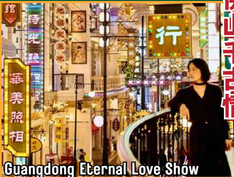
Guangdong Eternal Love Show

穿越历史，感受岭南风情 Travel Through History, Experience the Charm of Lingnan