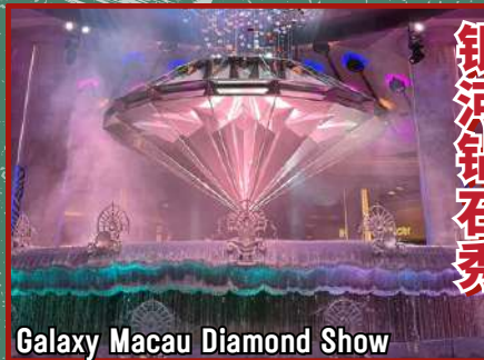
Galaxy Macau Diamond Show