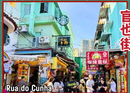
Rua do Cunha

闪耀斑斓，壕气炫丽 Dazzling and colorful, exuding luxurious brilliance