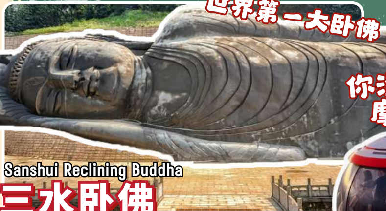
Sanshui Reclining Buddha