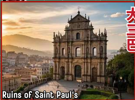
Ruins of Saint Paul's

This is where colors paint the soul of the world.